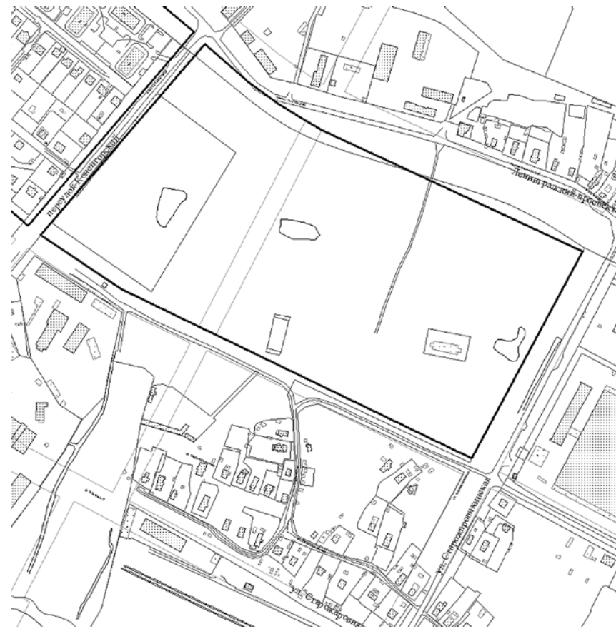
СХЕМА границ проектирования

Приложение к техническому заданию на подготовку проекта планировки территории в территориальном округе Варавино-Фактория г.Архангельска в границах пер.Концепогорского, просп.Ленинградского и ул.Старожаровихинской площадью 19,83 га